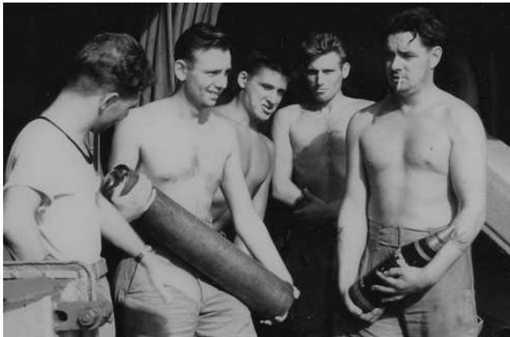
Telefonist en schrijver 2 e van links