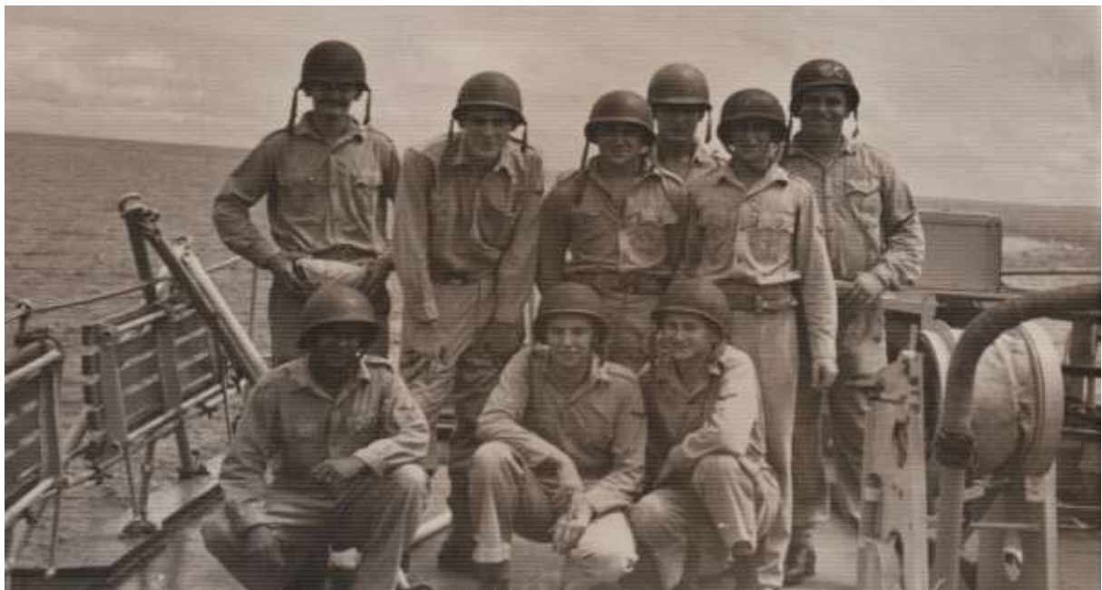
Telefonist en schrijver van dit verhaal midden onder

Ons kanon 4 had een enthousiaste geschut bemanning. Als we eenmaal schoten, wisten we niet van ophouden.