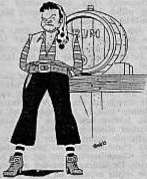
De bottelier van de wacht