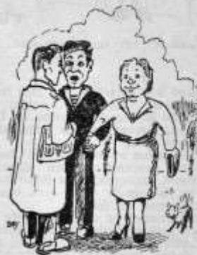
...TRUIDA, NUW ECHTGENOTE.....

De stoker had nog een gebrek, dat ik u nog niet verteld heb. Hij kon n.l. nooit zijn mond houden en ook nu had hij aan alle ziekenverplegers verteld, dat zijn meisje zo graag een foto van hem wilde hebben, maar dat hij er helaas niet één bezat. De ziekenverplegers trokken allemaal heel erg medelijdende en begrijpende gezichten,