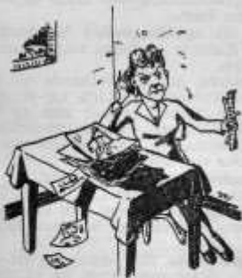
...ZOEK JOUW FOTO ER MAAR UIT...