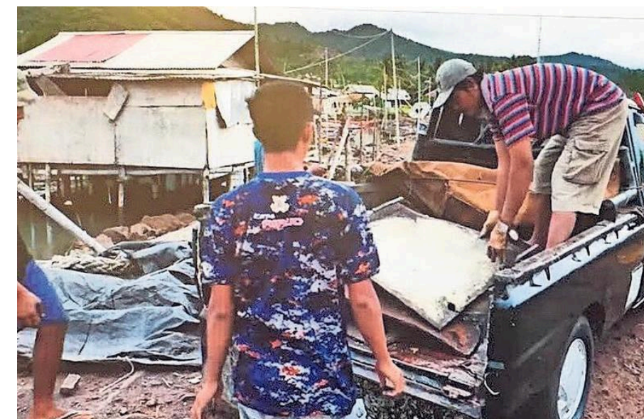
Zo voeren handelaren in kleine stukken gesneden stukken metaal af.