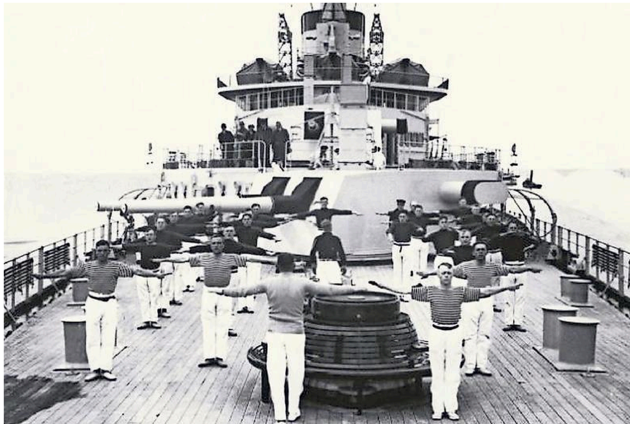
Matrozen doen lichamelijke oefeningen op het dek van Hr.Ms. De Ruyter vlak voor het uitbreken van de oorlog.

Na de afsluiting van de diefstal van schepen, komt daar het sollen met de stoffelijke overschotten nog