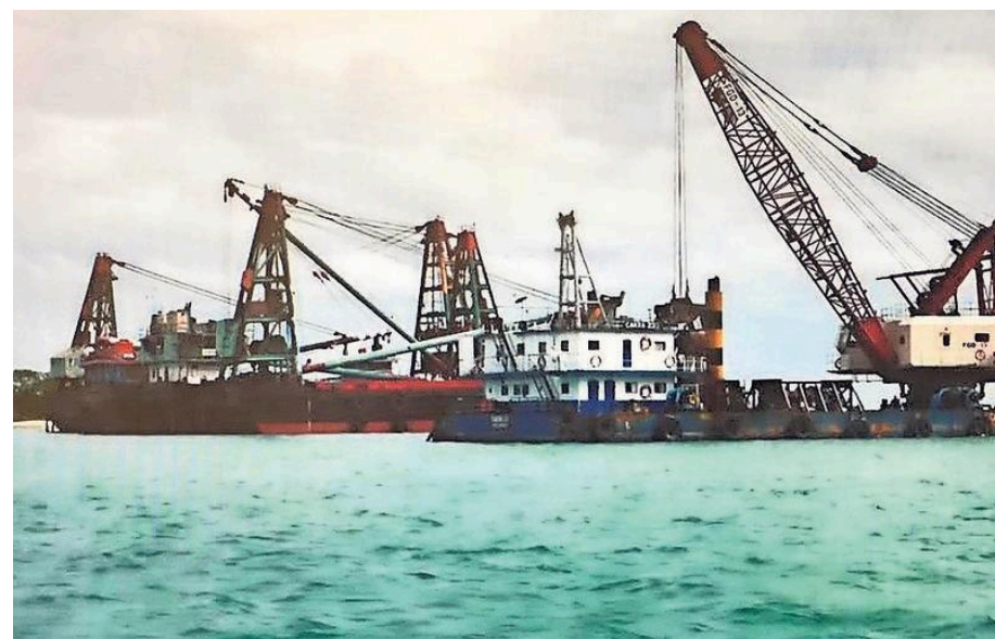
Dit soort baggerschepen haalt de wrakken in delen boven water.