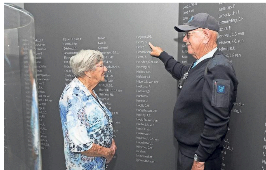
Namen van gesneuvelden in het Marinemuseum in Den Helder.

De krijgshaftige taal van sommige bewindslieden na de ontdekking van de roof in 2016 heeft wel plaatsgemaakt voor meer voorzichtige bewoordingen. Minister Zijlstra van buitenlandse zaken vraagt nu wederom om opheldering. Een heropening van het onderzoek lijkt noodzakelijk gezien de serieuzeheid van de recente onthullingen.